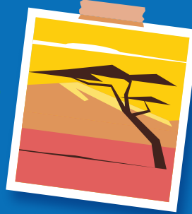
Teie reisi sihtkoht