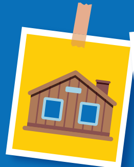
Teie majutuse liik