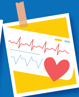
Teie haiguslugu ja üldine tervises seisund