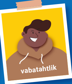
Teie reisi eesmärk

Näiteks on humanitaarabi töötajal reisides suurem risk nakatuda kui puhkuseraisijal.